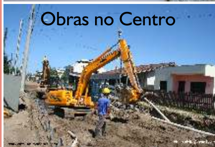
Obras no Centro