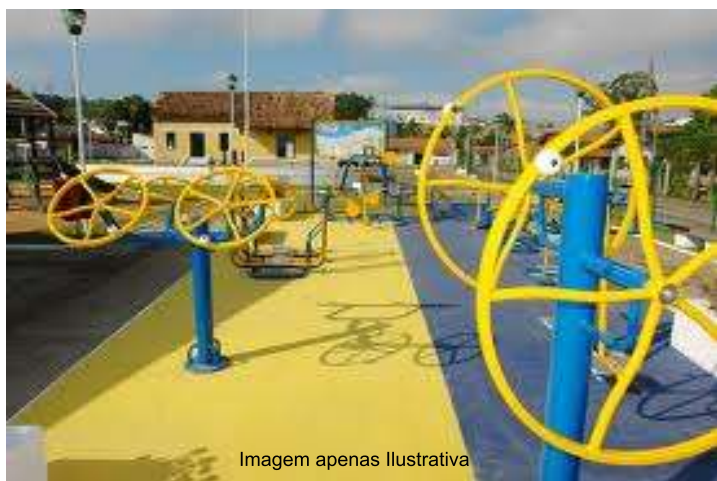
Imagem apenas Ilustrativa

R$ 180.000,00 para implantar e mais R$ 30.000,00 por mês para fazer funcionar