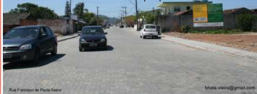
Obras no Bairro São Paulo

As principais obras da macrodrenagem do governo Lula/Dilma (PT) são: drenagem do Rio Gravatá, desassoreamento do Ribeirão das Pedras, do Ribeirão Guapuruma e a drenagem do canal da Radial Norte Sul. Além disso está grande obra consiste na construção de galerias no Centro e no bairro São Paulo. Serão beneficiados diretamente os moradores da Meia-Praia, Gravatá, Centro, São Domingos I e do São Paulo. Os investimentos do governo Lula/Dilma, nesta primeira etapa, devem chegar a R$ 21.404.850,16. O município terá que colocar como contrapartida apenas 5% deste valor. As obras são executadas pela prefeitura