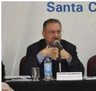
Volnei Morastoni (PT) Deputado Estadual e Presidente da Comissão de Saúde da Assembleia Legislativa

Foi realizada em junho, na cidade de Itajaí, uma audiência pública promovida pela Comissão de Saúde da Assembleia Legislativa, presidida pelo deputado Volnei Morastoni (PT).