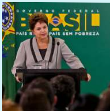
Presidente Dilma (PT)

Durante a entrega de 580 apartamentos do programa 'Minha Casa, Minha Vida, na cidade de Blumenau, a Presidente Dilma Rousseff (PT) garantiu que a rodovia BR-470 será duplicada. “A BR 470 será duplicada o mais breve possível. É uma grande obra, necessária para o desenvolvimento de Santa Catarina e do Brasil”, disse a presidente.