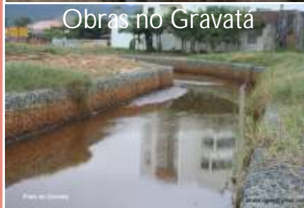
Obras no Gravatá