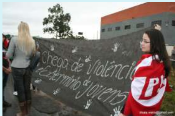
Lideranças da Pastoral da Juventude em manifestação na BR 470

Lideranças políticas e empresariais de Navegantes estiveram em reunião no DNIT, em Florianópolis, no último dia 28 de novembro. Para melhorar a segurança entre os Kms 2 e 10 da BR 470, o DNIT se comprometeu a instalar redutores de velocidade e lombada eletrônica. A colocação de tachões - para impedir ultrapassagens - será objeto de estudo do setor de engenharia do órgão. O DNIT informou que a prefeitura está autorizada a construir uma rótula na BR 470, no acesso a Pedreiras.